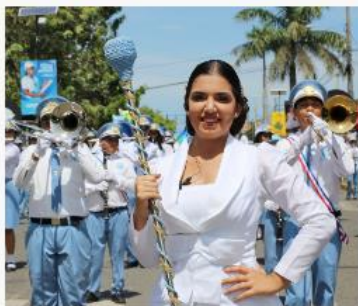
Banda de Música