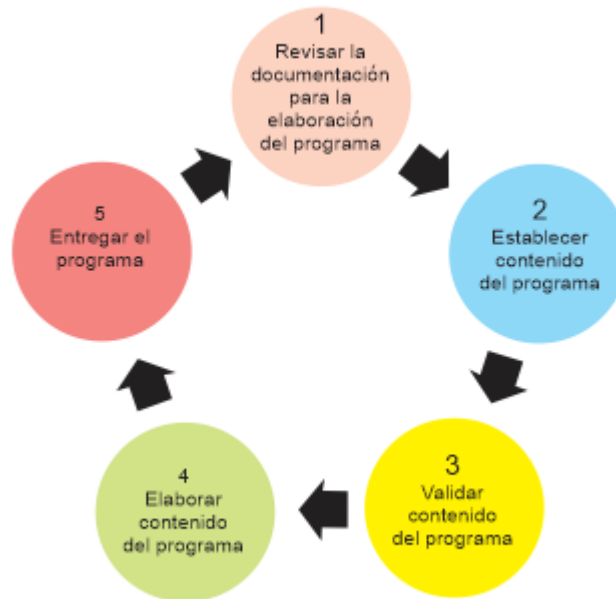
Tabla 5 Diagrama de Flujo de la Propuesta