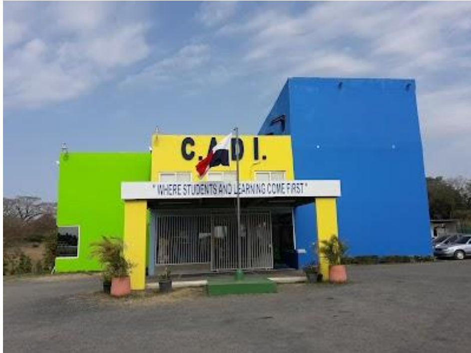
Anexo 2: Logotipo de CADI Bilingual Academy